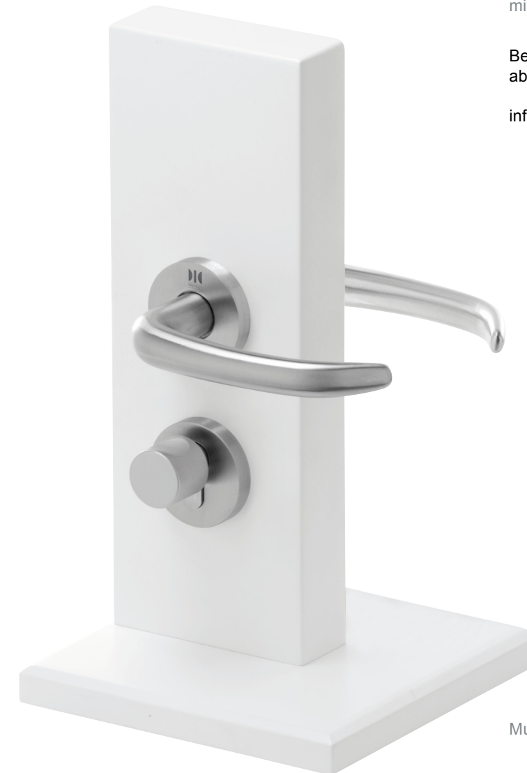
Musterblock auf Anforderung